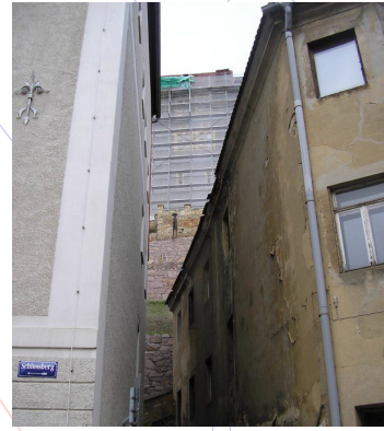
Blickachse zu Standort 1