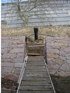
Blickachse zu Standort 2