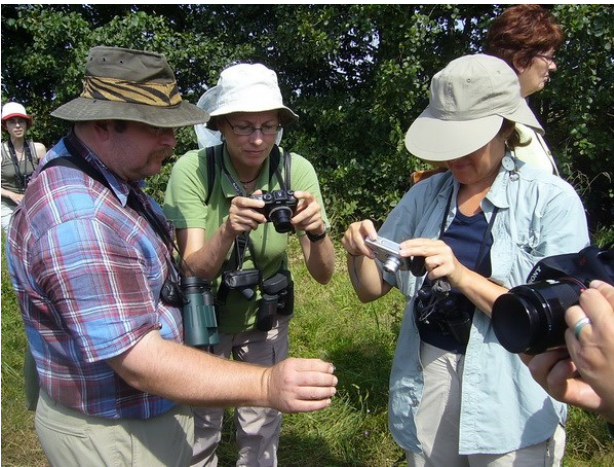
Foto: Artenkenntniskurs 2018, Niederspree

In täglichen Exkursionen wird das Wissen im Gelände angewandt und vertieft.