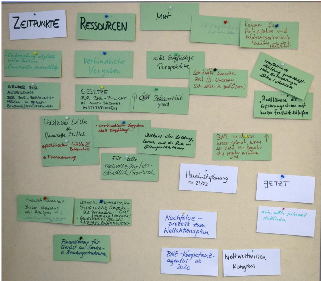
Abbildung 2 Ressourcen und günstige Zeitpunkte