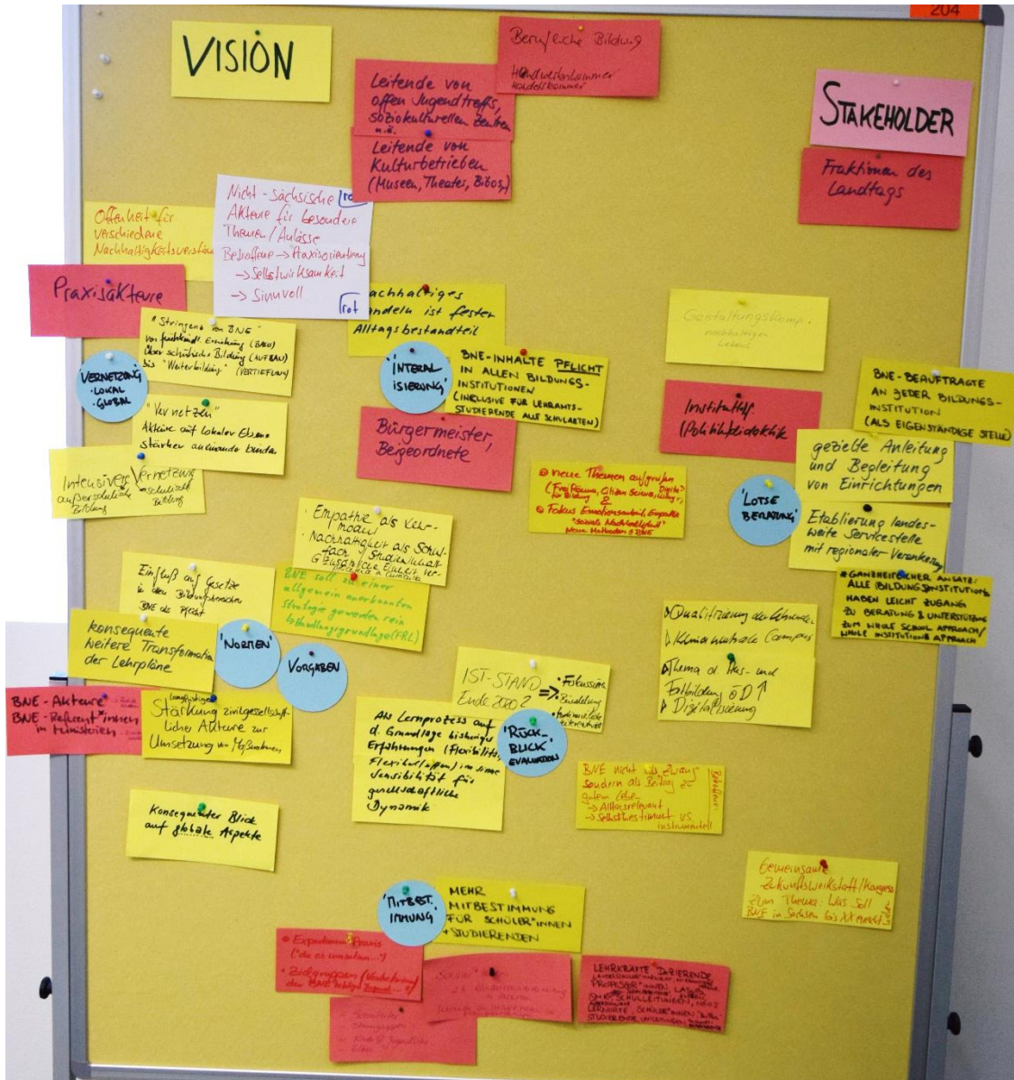
Abbildung 1 Visionen und Stakeholder