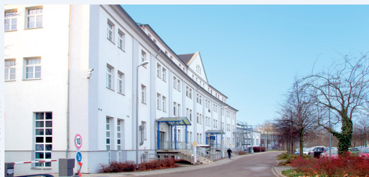
Leipziger Verkehrsbetriebe GmbH