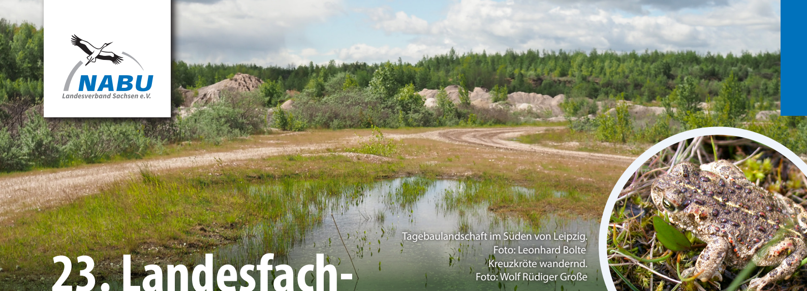
Tagebaulandschaft im Süden von Leipzig. Kreuzkröte wandernd.