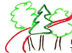
Forstbotanischer Garten Tharandt