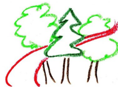
Forstbotanischer Garten Tharandt Sächsisches Landesarborëtum

Dieser Flyer ist gedruckt auf 100% Recyclingpapier.